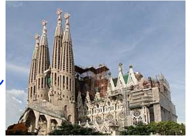
サグラダ・ファミリア（スペイン）

スペインのバルセロナから、6名の留学生が本学にやって来ます。伝統文化「人間の塔」による交流や、研究内容（生物学）による交流、そして「カタルーニャ独立問題（国際政治学）」をテーマにしたディスカッション交流などのプログラムです。皆さんの積極的な参加をお待ちしています。