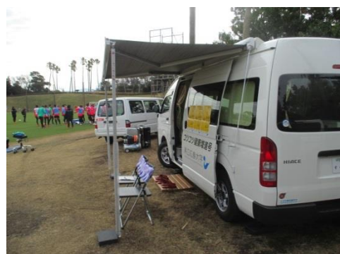
サンフレッチェ広島 鹿兒島キャンプに参加しました

○場所：エディオンスタジアム広島 お祭り広場 （広島県広島市安佐南区大塚西5-1-1）