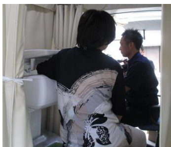
前腕の骨密度測定