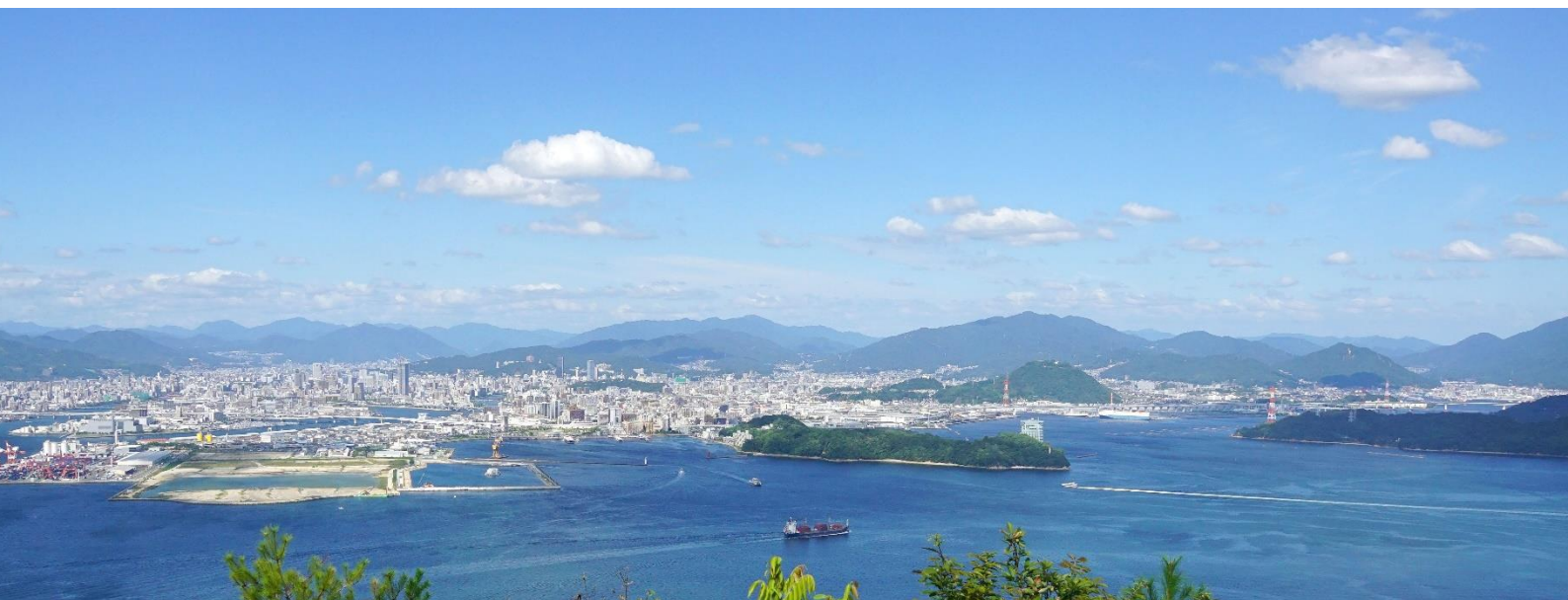
似島・安芸小富士から望む、広島街並みと瀬戸内海