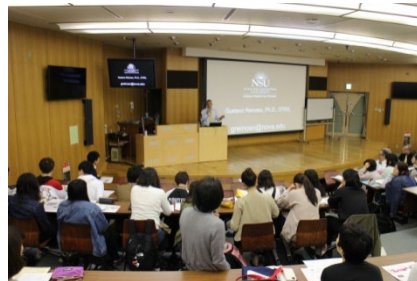
ノバサウスイースタン大学の講師による講義

世界の作業療法をリードする アメリカ、カナダ の研究者と交流し、来日の際には最新の研究結果に基づく特別講義を開催しています。2017年4月には、米国のノバサウスイースタン大学から2名の講師を招いて、作業科学や発達障害児の感覚特性に関する講義を受け、ディスカッションを行いました。2016年には、6名の学生が オーストラリア のベリーメンズシードを訪れ、高齢者のものづくりを通じた健康活動の取り組みを学びました。また、1年次生が授業の一環で スコットランド のクイーン・マーガレット大学の学生とメールを交換し、文化が作業に与える影響について考察しました。