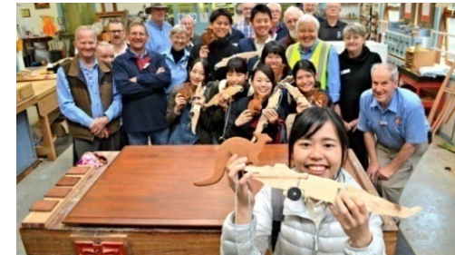
オーストラリアのベリーメンズシード訪問の様子