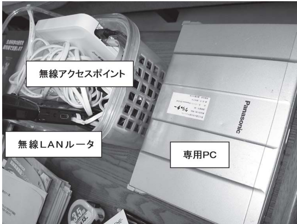
図1 クリッカーシステムKéndai Pochi

PCとシステムは一本のイーサネットケーブルで繋がっている。電源を入れるだけでセットアップは完了する。